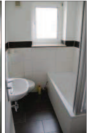
... und nach der Sanierung.

der Wohnungen werden die Mieter involviert. „Wir hoffen, eine Auswahl von Bodenbelägen und Wandfarben zur Verfügung stellen zu können, damit die Mieter weiterhin die Wohnungen individuell gestalten können“, so Timo Bunger von der KWL. Möbel und Einbauküchen werden nicht von der KWL gestellt.